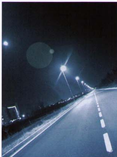
Bild 2: Straßenbeleuchtung – Ein bereits bestehendes dichtes Netz mit Potenzialen für die Zukunft