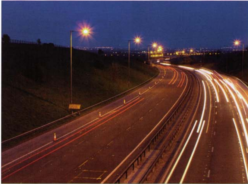
Bild 3 Die Laterne – Nicht nur Lichtpunkt, sondern auch Mess- und Schnittstelle in Daten- und Kommunikationsnetzen

serwartung der Lampen verlängert werden. Damit wird auch der CO 2 -Ausstoß durch das selektive Schalten und Dimmen der Leuchten deutlich verringert. Darüber hinaus steuert, regelt, überwacht und dia-